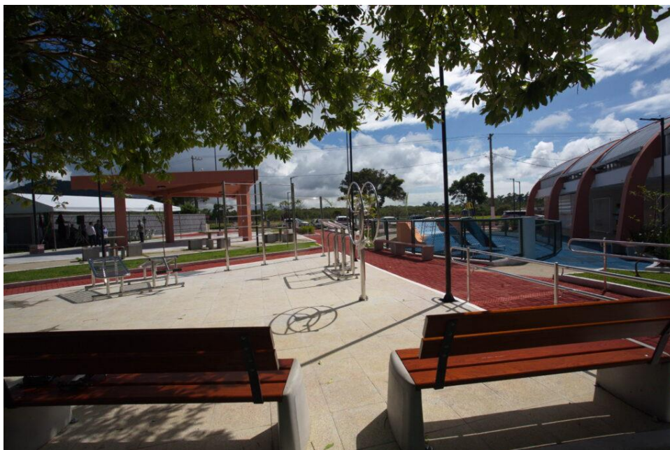
Praça na comunidade de Chapada do Á

descoberto, área multiuso, equipamentos de academia, arquibancada, sala de leitura e banheiros. As obras duraram um ano, sendo priorizada a contratação de mão de obra local. A estrutura foi construída a pedido da comunidade, em atendimento a condicionante da Licença Operacional da Usina III, no Complexo de Ubu, em Anchieta (ES).