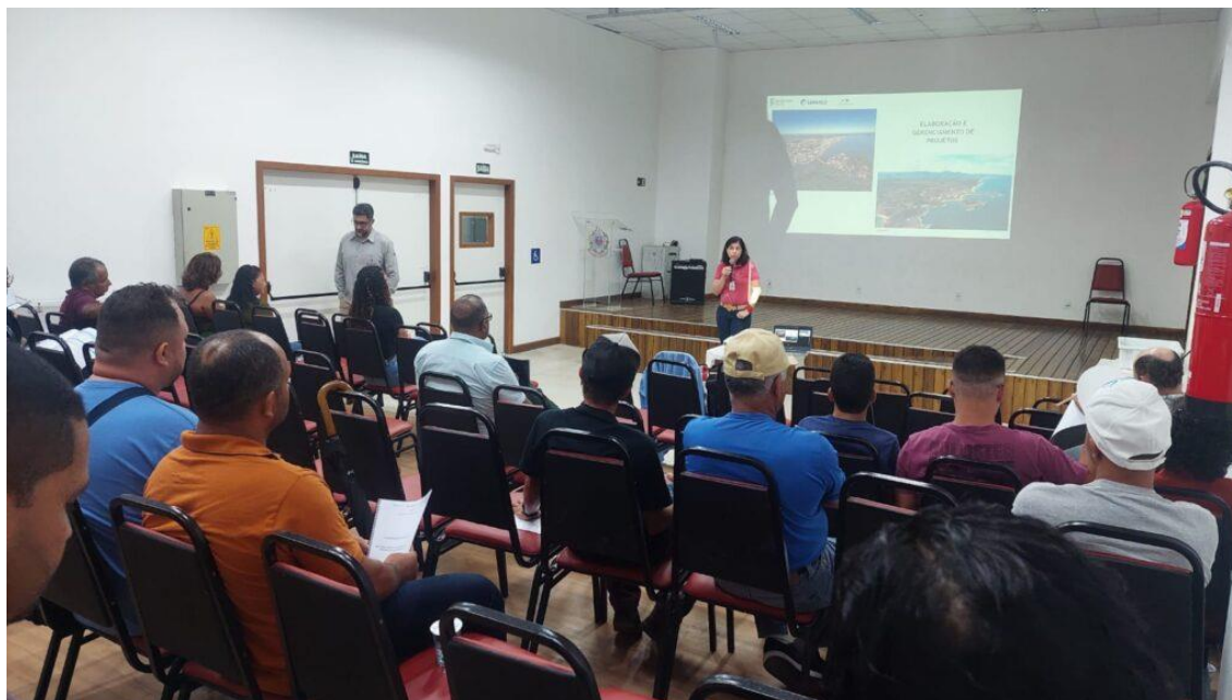
Associações de Moradores e Pescadores de Anchieta e Guarapari (ES)

terminou em dezembro com a finalização de visitas técnicas para assessoria às comunidades. O curso teve duração de dois meses e foi dividido em dois módulos teóricos, além da parte prática com assessoria em elaboração de projetos. A iniciativa contou com a participação de 70 pessoas de 13 comunidades.