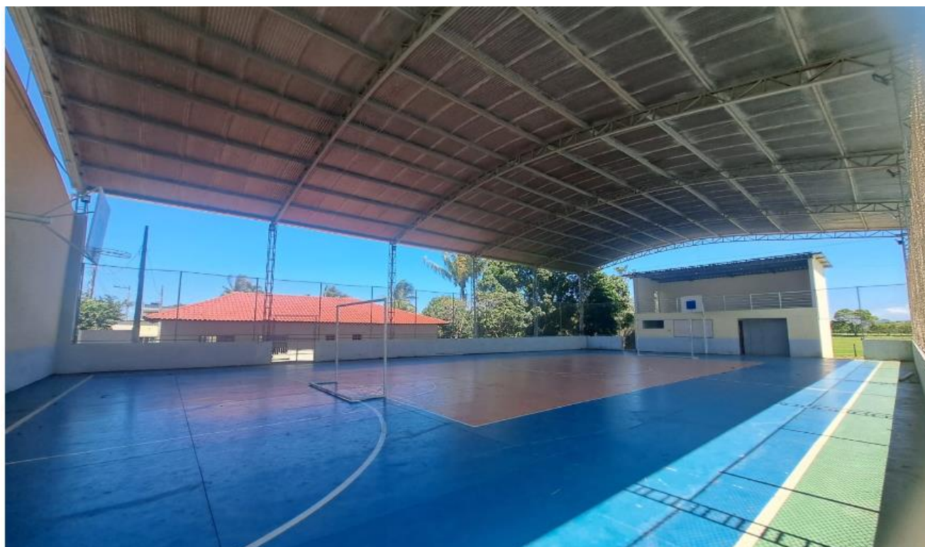
Ginásio Poliesportivo da comunidade para realização do festival do caranguejo.